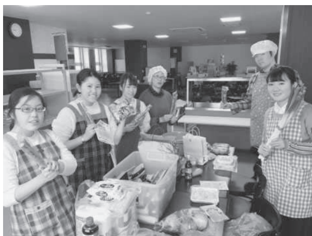
学生委員会「食育メンバー」で特産品を調理。