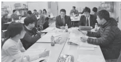
班内での討論の様子

東北六県の正規職員の労働条件統一について協議を進めているが、その重要な部分となる「正規職員就業規則」の改定について提案があり審議しました。