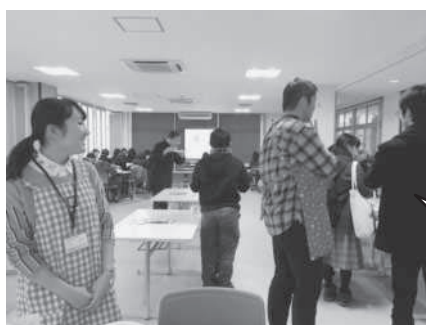
調理したメニューは会場で試食として配布し、気軽に立ち寄れる雰囲気。