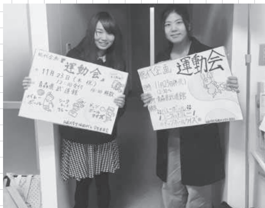
11月に開催した総代企画「大運動会」の呼びかけ