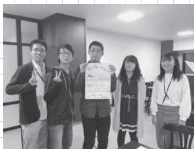
「大運動会」での競技説明を作成