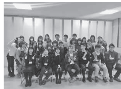
公務員講座 合格者と受講生交流会の様子

公務員試験では11月ごろまで試験がある自治体もあります。民間企業の就職状況がよくなって3~5月には友人の民間内定が決まっていく中、最後まで試験をクリアしていくのは大変なことだと思います。今年は講座では7月以降の2次試験対策に力を入れ、137人が公務員に内定しました。