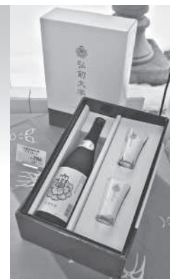
写真は弘前大学の徽章入り グラスセット

生協店舗サリジェ・SAHREA・医学部店FERIOまたは弘前大学生協HP>ショッピングのページからもお求めいただけます。