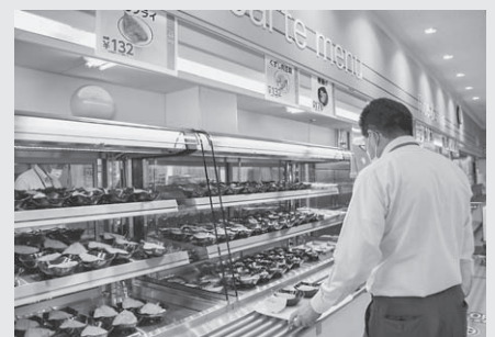
(左) 以前のカウンター (真ん中・右) 新規導入したショーケース。商品を選びやすく取りやすくなりました。