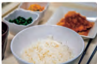
学生の胃袋と青春を支える！弘前 大学生協食堂「Horest」が選んだ 「はれわたり」 はれわたるところ 2026.02.26

「青森のうまいものたち」 あおもり産品情報サイトで県産米「はれわたり」を使用しているお店として食堂Horestが紹介されました。