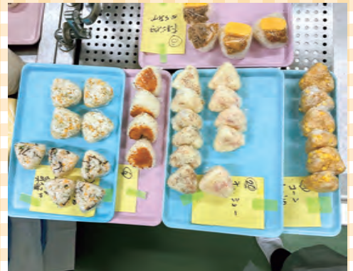
(左) (上) 試作の様子 (下) 出食されたおにぎり