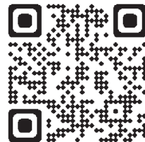
たすけあい奨学制度について