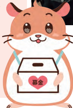
たすけあい奨学制度イメージキャラクター「ヘルム」