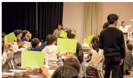
(昨年の総代会の様子です)