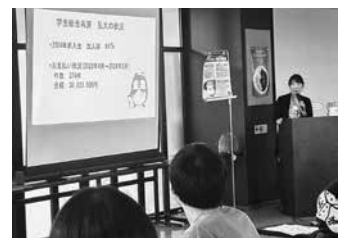
(右) 学生総合共済について