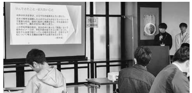
(上) Peace Now! OKINAWA 報告