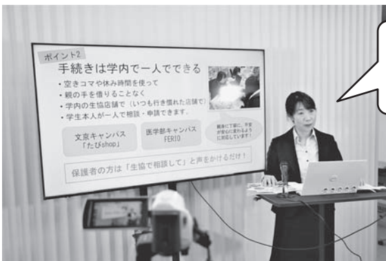
(←) サポートセンター職員から学生総合共済に関する話