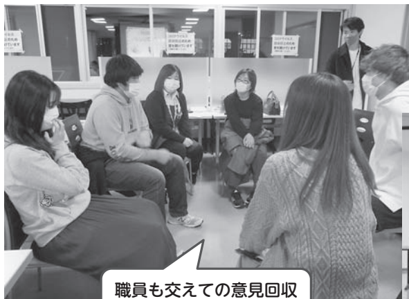
職員も交えての意見回収