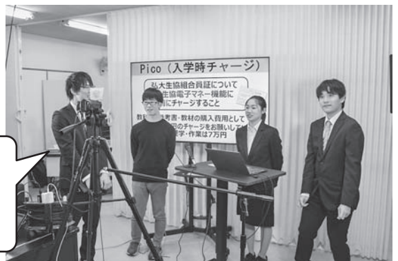
(→) 各発表者への全体質問。チャットで質問が寄せられるので、お応えしていきます。