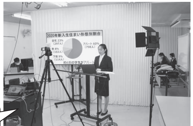
(↑) 発表の様子。視聴している方は発表者とモニターが見えます。 (→) 会場の様子。周りに他の発表者やスタッフが控えています。

総合選抜の受験生・保護者向け説明会では、充実した大学生活をテーマに入学準備にかかる費用や高校と大学の違い、弘大生の大学生活をサポートしている各種商品・サービスの概要を私の経験談を織り交ぜながら説明しました。今回は新型コロナウイルスの感染拡大防止のためオンラインでの実施となり、受験生・保護者の生の雰囲気を感じとることはできませんでした。ですが、画面の向こうの方々にも学生生活の具体的なイメージが膨らむよう、写真やグラフなどの視覚情報をできるだけ多く取り入れ、カメラ目線にも配慮しました。参加して下さった受験生ご本人と保護者様が少しでも入学後のイメージを持ち、合格が決まったらサポートセンターに来場してくれるといいなと思っています。