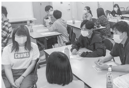
交流もできるだけ距離をとって…。

今回は、コロナウイルス感染症対策をしっかり行ったうえで、新規総代のみを対象に、間隔を空けながらの開催になったため、「総代同士の初顔合わせをする。」「総代や総代会のイメージを持ってもらい、その中身について知ってもらう」ことを目的で開催しました。