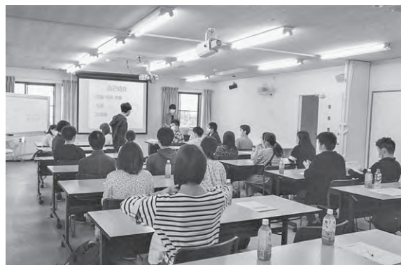
参加前に手指の消毒、マスク着用の確認を行いました。

マスク着用や、席の感覚を空けたこと、ほとんどが初対面であることもあり、会が始まった当初は盛り上がり欠けていたが、活動を考える時間には総代同士で交流が生まれました。一部友達同士で参加している総代がいたので、より活発な交流になったと思います。