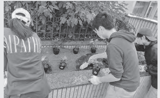
暑い日だったので熱中症に気を付けて作業しました