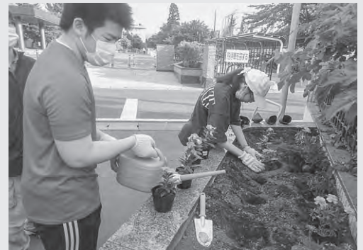
少人数、マスク着用で行いました